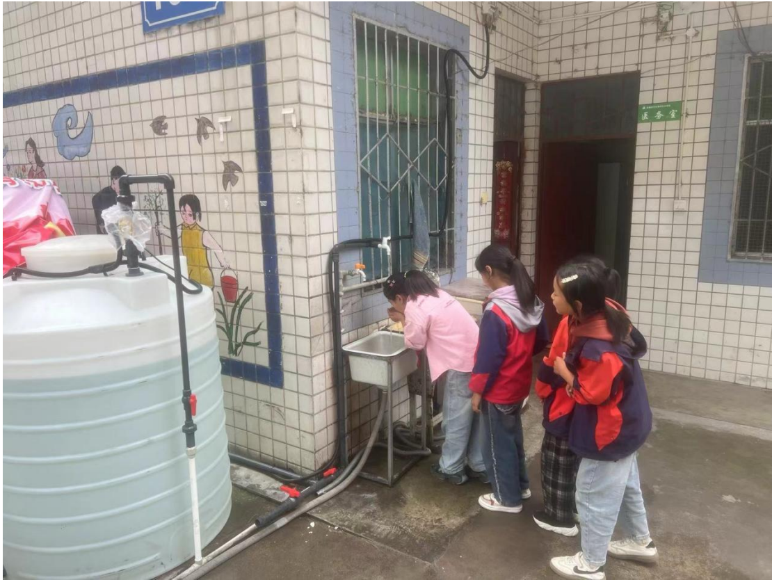
2024年6月19日，全校师生开始饮用处理后的纯净水源

献自己的力量。与此同时，公司还将与渠道伙伴及客户携手同心，共同致力于传递爱与温暖，为安盛全球的公益活动注入中国力量。