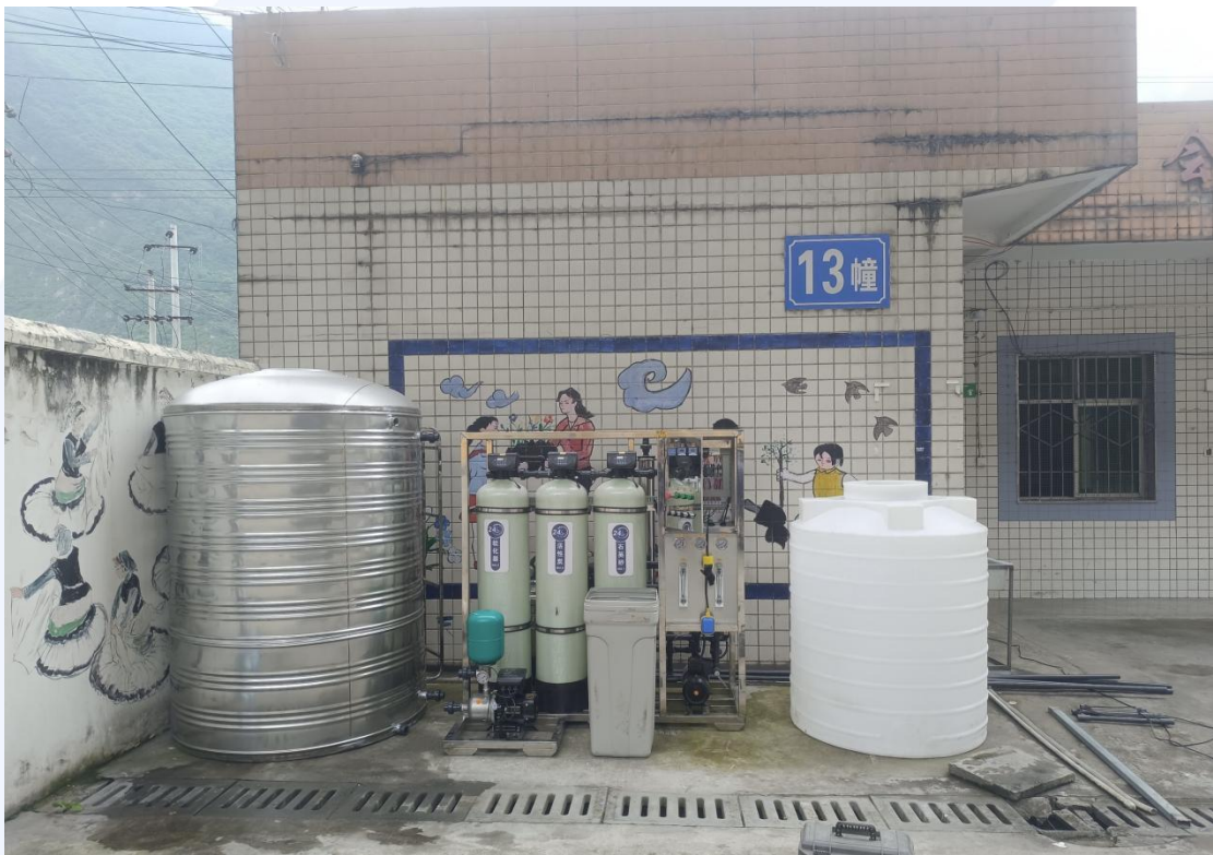
2024年6月18日，反渗透纯净水设备完成安装

6月3日至6月7日，安盛天平财产保险有限公司（以下简称“安盛天平”）全员志愿者活动周圆满举行。该活动源自安盛集团一年一度的员工志愿者盛事——“安盛筑爱在行动”，今年活动的主题聚焦“水健康”，安盛天平在全国各地的员工踊跃参与爱心志愿者活动，为四川省凉山彝族自治州乃拖镇中心校的困境儿童提供安全、健康的饮水条件，以涓滴爱心滋润心田，助力孩子们健康成长。